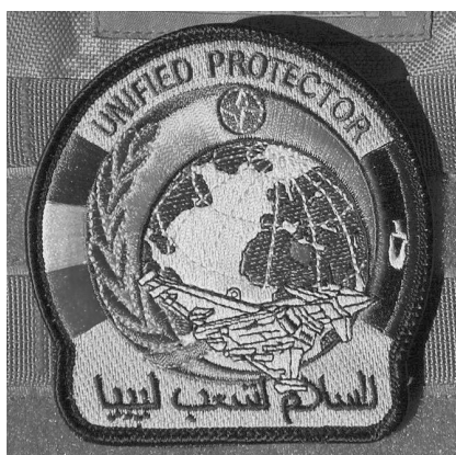
Нарукавная нашивка участника операции «Объединенный защитник» (Италия).

Выход, тем не менее, был найден: Белый дом заявил, что операция в Ливии не может считаться собственно «войной» по той причине, что «[вооруженные силы] Соединенных Штатов играют ограниченную и вспомогательную роль [в составе] международной коалиции... Операции США не предполагают ни продолжительные боевые действия, ни активный обмен огневymi ударами с